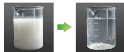
添加後速やかに凝集します

反応速度が速く添加後速やかに凝集し、 大きなフロックを形成しながら沈降します。 有機系/無機系、両方の汚濁水に対して優れた凝集効果を発揮します。 少ない添加量で強力な凝集効果を発揮します。 凝集後の上澄水の透明度が高く、濁りが殆どありません。 粉体のまま水中に投入する事が出来、溶解効率にも優れ中性である為、 設備が簡素化され毒劇物にも該当せず取扱いが容易です。